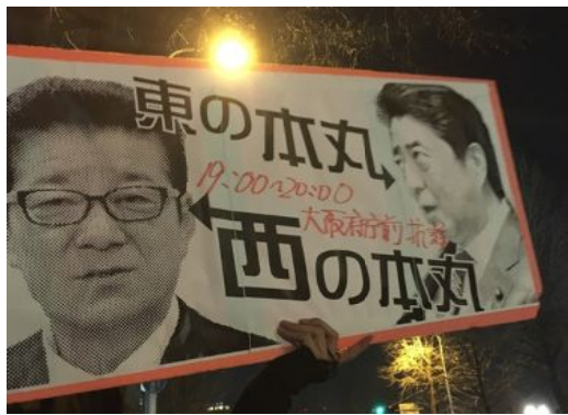
3月12日以来連日行われている府庁前抗議行動

この1年、真相究明を求めてきた森友学園問題に大きな進展がありました。3月2日朝日新聞は、「財務省が決裁文書を書き換えた疑いがある」と報道。3月9日、森友学園への国有地売却を担当する部署に所属していた近畿財務局の職員が自殺したという報道が入った直後、当時、財務省