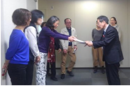
エール学園支部 無期雇用転換申し入れの様子

4月5日、エール学園(日本語学校)に勤務する組合員8名が、法人に無期雇用転換の申し入れを行い受理されました。その場で受領書は貰え